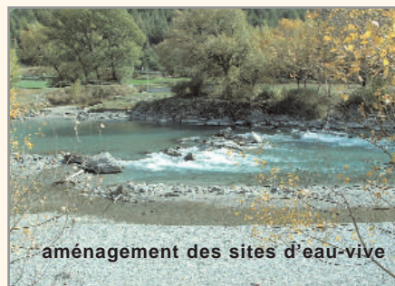
aménagement des sites d'eau-vive