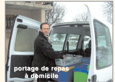
portage de repas à domicile

La communauté de communes demande de son personnel une grande souplesse d'organisation, de la polyvalence et de la créativité : 44,5 équivalents temps plein travaillent d'abord au contact de la population ; seuls 5 postes s'occupent de gestion administrative de la collectivité, soit moins d'un dixième des effectifs. Des stagiaires de qualité viennent renforcer ces effectifs.