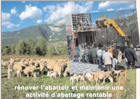
renover l'abattoir et maintenir une activité d'abattage rentable

● La mise aux normes de l'abattoir : elle vise à maintenir une activité d'abattage rentable dans le nord du département et conditionne l'existence d'une filière courte de commercialisation. Elle permet aux éleveurs de 6 communautés de communes de poursuivre et développer leur activité rentablement et de valoriser la grande qualité de nos viandes locales.