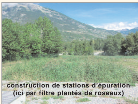
construction de stations d'épuration (ici par filtre plantés de roseaux)

● La construction d'équipements efficaces pour la gestion des ordures ménagères et l'assainissement permet de conserver un territoire propre en adéquation avec l'image "authentique" du Guillestrois.