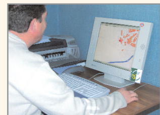
Installation d'un Système d'Information Géographique dans chaque mairie