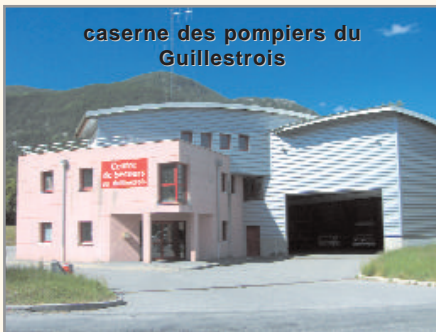
caserne des pompiers du Guillestrois

● La réalisation de centres de secours saisonniers et annuels répond aux exigences de sécurité d'un territoire aux ambitions touristiques importantes.