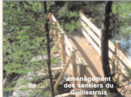
aménagement des sentiers du Guillestrois

● Les signalisations pour les sports d'eaux vives, l'aménagement des berges et l'entretien des sentiers de randonnées améliorent les équipements sportifs et consolident la fréquentation touristique du Guillestrois.