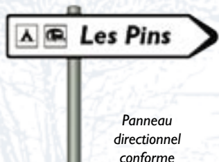
Panneau directionnel conforme

Les panneaux directionnels sont homologués et peuvent s'installer sur un mât existant ou faire l'objet d'un nouvel aménagement. Le texte apparaît toujours en italique. Des idéogrammes peuvent apparaître.