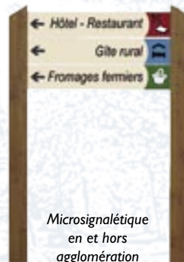
Microsignalétique en et hors agglomération