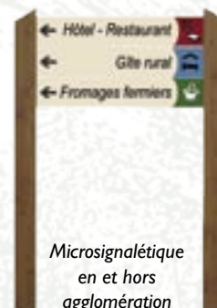
Microsignalétique en et hors agglomération

• Dans les agglomérations (ou à proximité de celles-ci), où il y a beaucoup d'informations, notamment dans les villages à forte attraction touristique, votre établissement peut figurer sur des « barrettes » implantées selon un plan de jalonnement mis au point avec l'ensemble des activités concernées. Ces barrettes ne peuvent pas être cumulées avec des préenseignes (2 barrettes = 1 préenseigne).